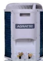
CONDENSADORA TOP DISCHARGE